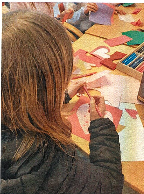
Vejen. Valentinskort og kreativ skrivning

Tenk alternativt ang arbeidstid og sted.