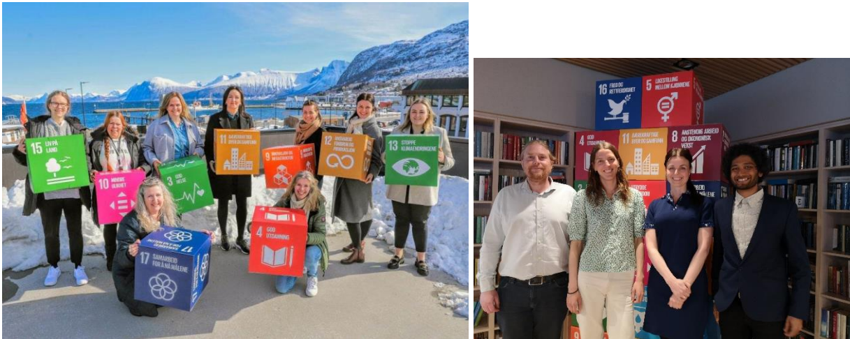
Figur 1: Foto: Ole-Ottar Høgstavoll, Vikebladet og Kersti Hasund. Arbeid med berekraft på Hareid folkebibliotek.

Dei opplevde det som utfordrande å vere få tilsette på eit større prosjekt som krevjar mykje planlegging og arbeidskapasitet for å få gjennomført nye tiltak og tilbod. I ettertid ser dei at det er ein del av drift og andre tilbod dei har som kunne i større grad vore knytt opp til prosjektet.