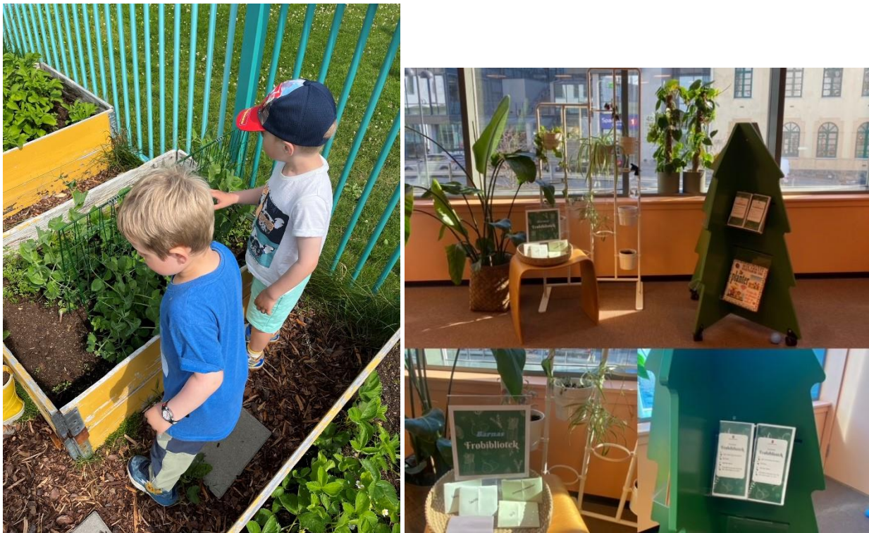
Figur 4: Foto: Ålesundsbiblioteka. Lepsøy barnehage på frøbibliotekkurs og Barnas frøbibliotek på Ålesund bibliotek.

Ålesund kommune vart delt i to frå 01.01.2024, og både i nye Ålesund kommune og i nye Haram kommune ønsker dei å fortsette arbeidet med berekraft. Biblioteka i kommunen har gjennom prosjektet fått vere i bresjen for arbeidet med berekraft, som er eit av satsingsområda i kommunane.