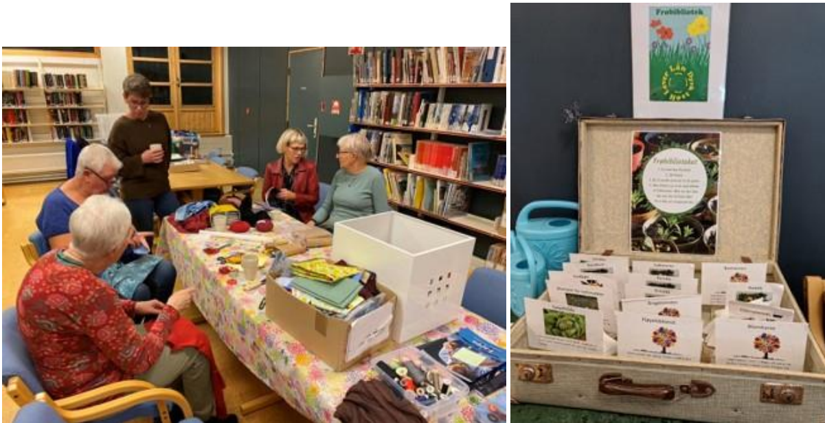
Figur 3: Redesign og frøbibliotek på Sunndal folkebibliotek.

Sunndal folkebibliotek skal fortsette å jobbe med berekraftsmåla etter prosjektet. Det er blitt ein naturleg del av alt dei gjer, og hjelper dei med å forankre og synleggjere arbeidet dei gjer både for politikare og administrasjon i kommunen og til besøkande og innbyggjarane i Sunndal kommune.