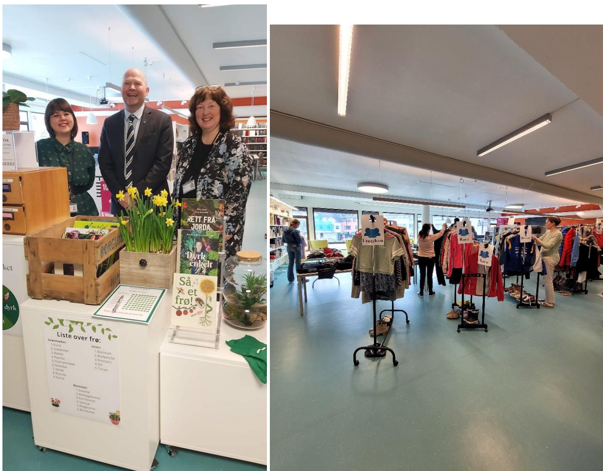
Figur 1: Opning av frøbibliotek med ordførar og «Den store klesbyttedagen» på Sula bibliotek.

Sula bibliotek har blitt meir bevisste på berekraft, og som etter prosjektet gir seg utslag i måten dei tenker på, og kva for nye tilbod dei vil fokusere på å presentere i biblioteket framover. Biblioteket blir opplevd som ein viktig berekraftskaktør internt i kommunen, men også av nye brukarar som har funnet vegen til biblioteket gjennom prosjektet.