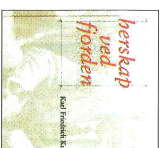
På norsk: Herskap ved fjorden, utgjeven på Skald forlag.