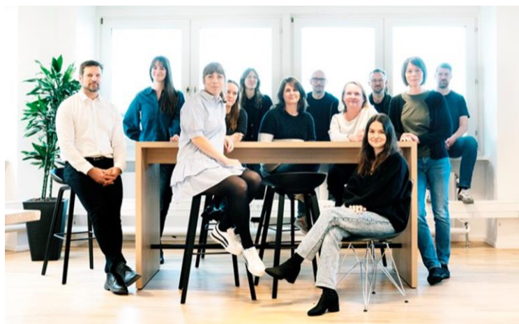
Figur 1: 12 av 15 ansatte fra Det Digitale Folkebibliotek i Danmark.

Det Digitale Folkebibliotek har 15 ansatte og et driftsbudsjett på 50 millioner danske kroner, i tillegg til 100 millioner danske kroner fra folkebibliotekenes mediebudsjett.