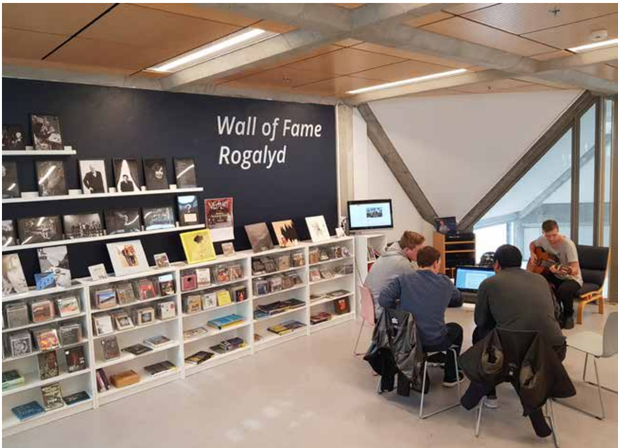
3. etasje. Rogalyd Wall of Fame