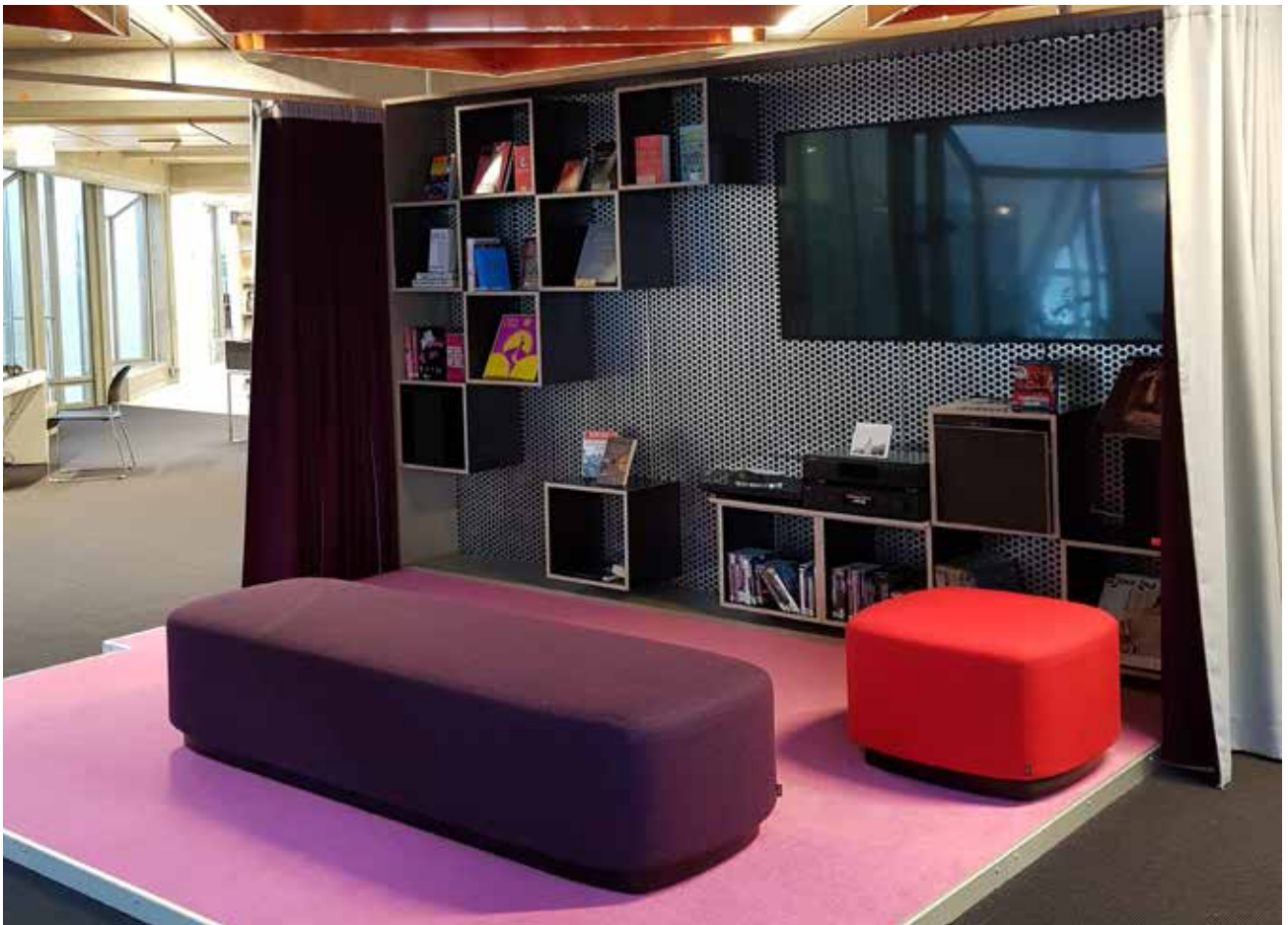
3. eatsje. Musikkmiljø.