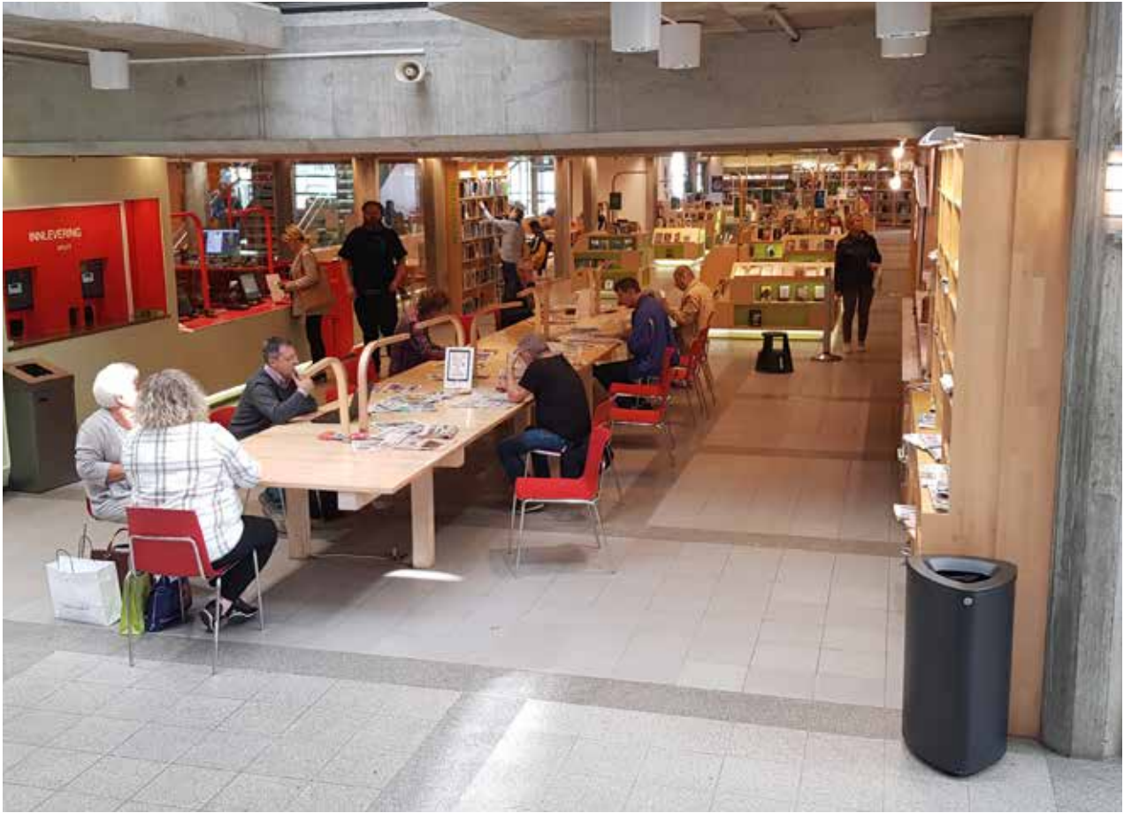
Oversiktsbilde 1. etasje