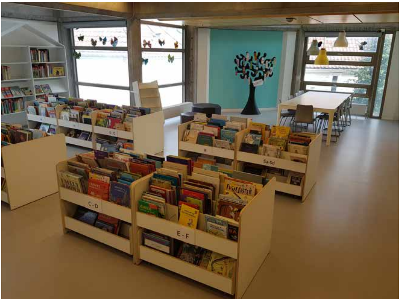
Oversiktsbilder 2. etasje