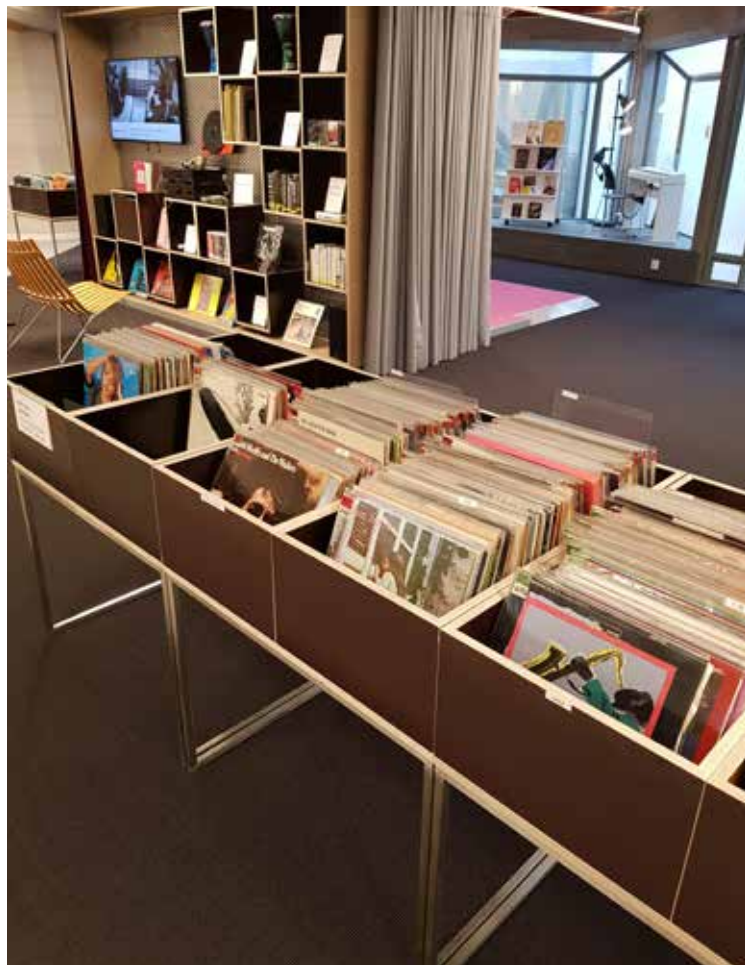
3. etasje. Musikkmiljø