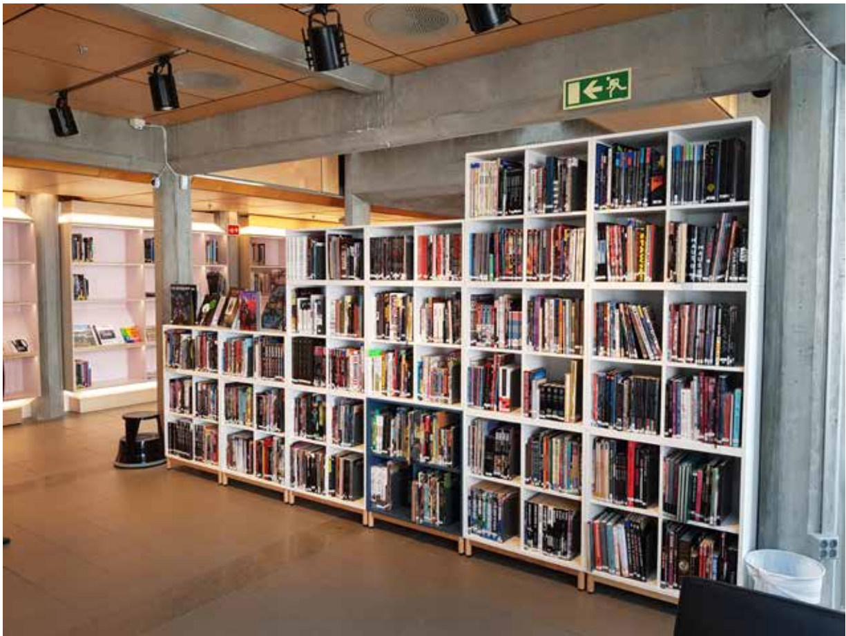
Oversiktsbilde 2. etasje. tegeneserier