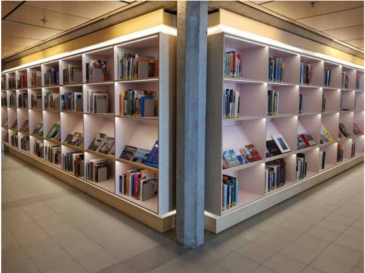
Oversiktsbilder 2. etasje. Kunstbøker.