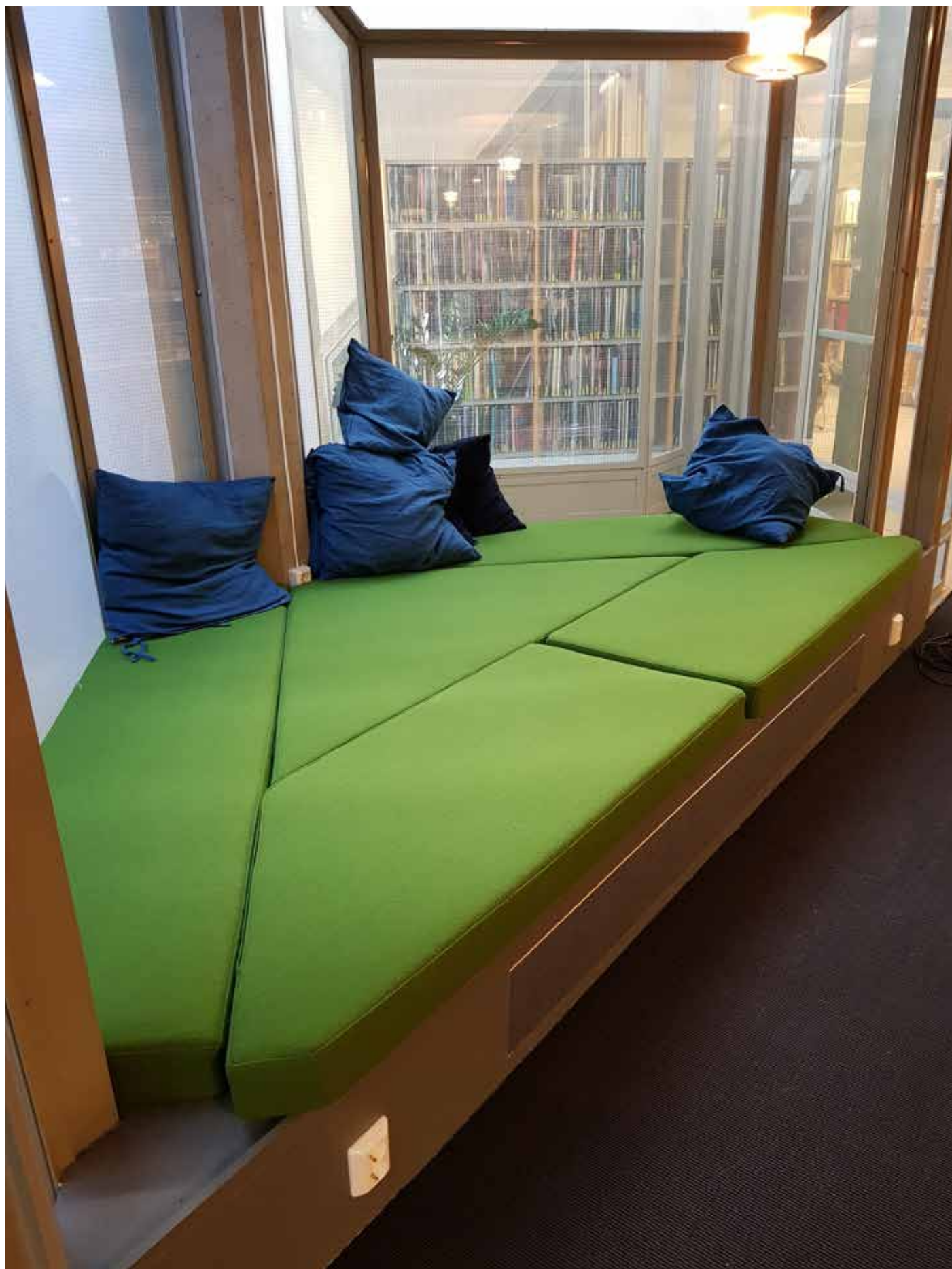
3. etasje. Musikkmiljø