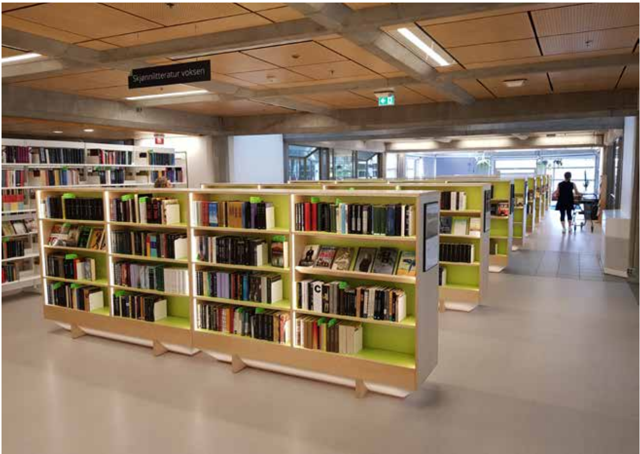
Oversiktsbilder 2. etasje