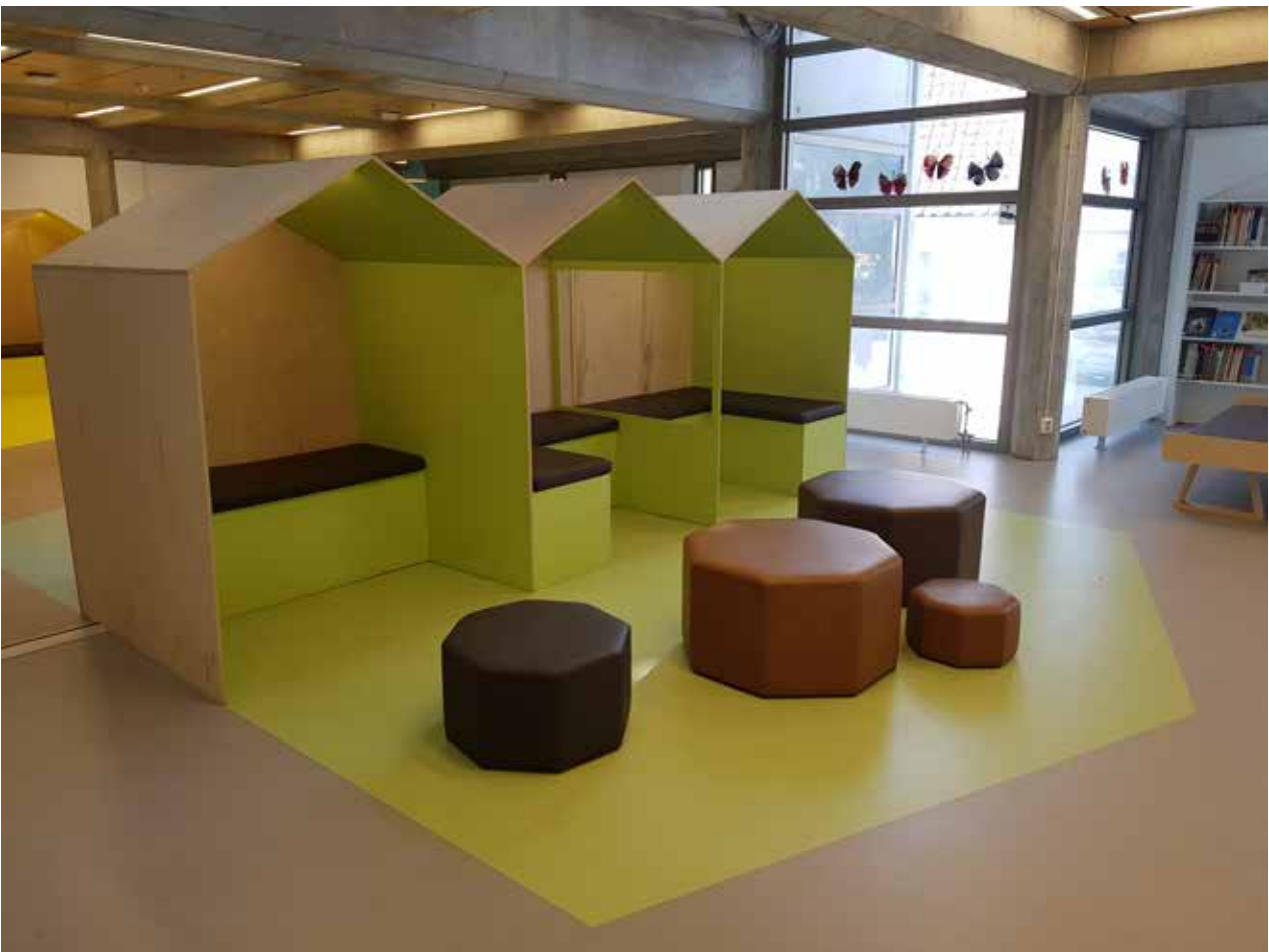
Oversiktsbilder 2. etasje