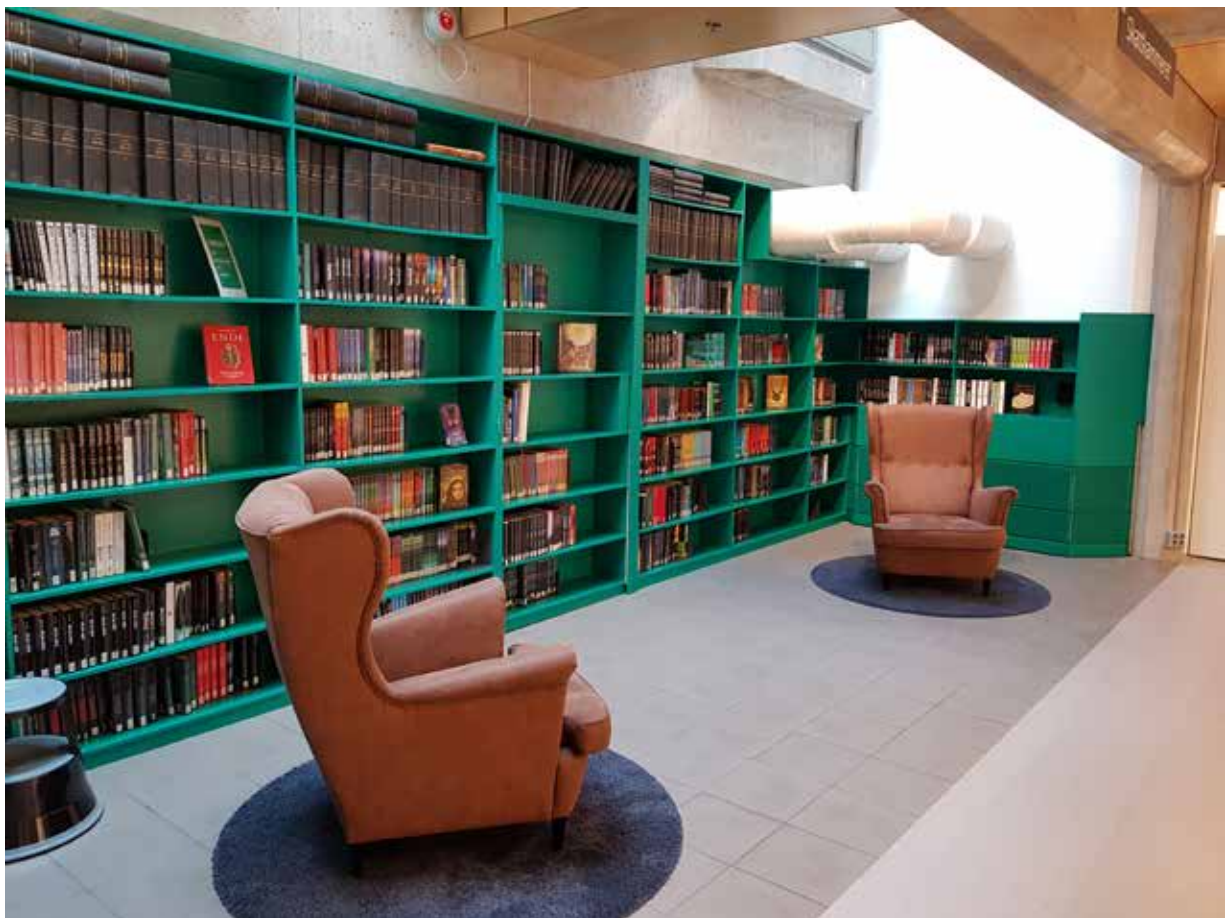
Oversiktsbilder 2. etasje. Inngang til Skattkammeret.