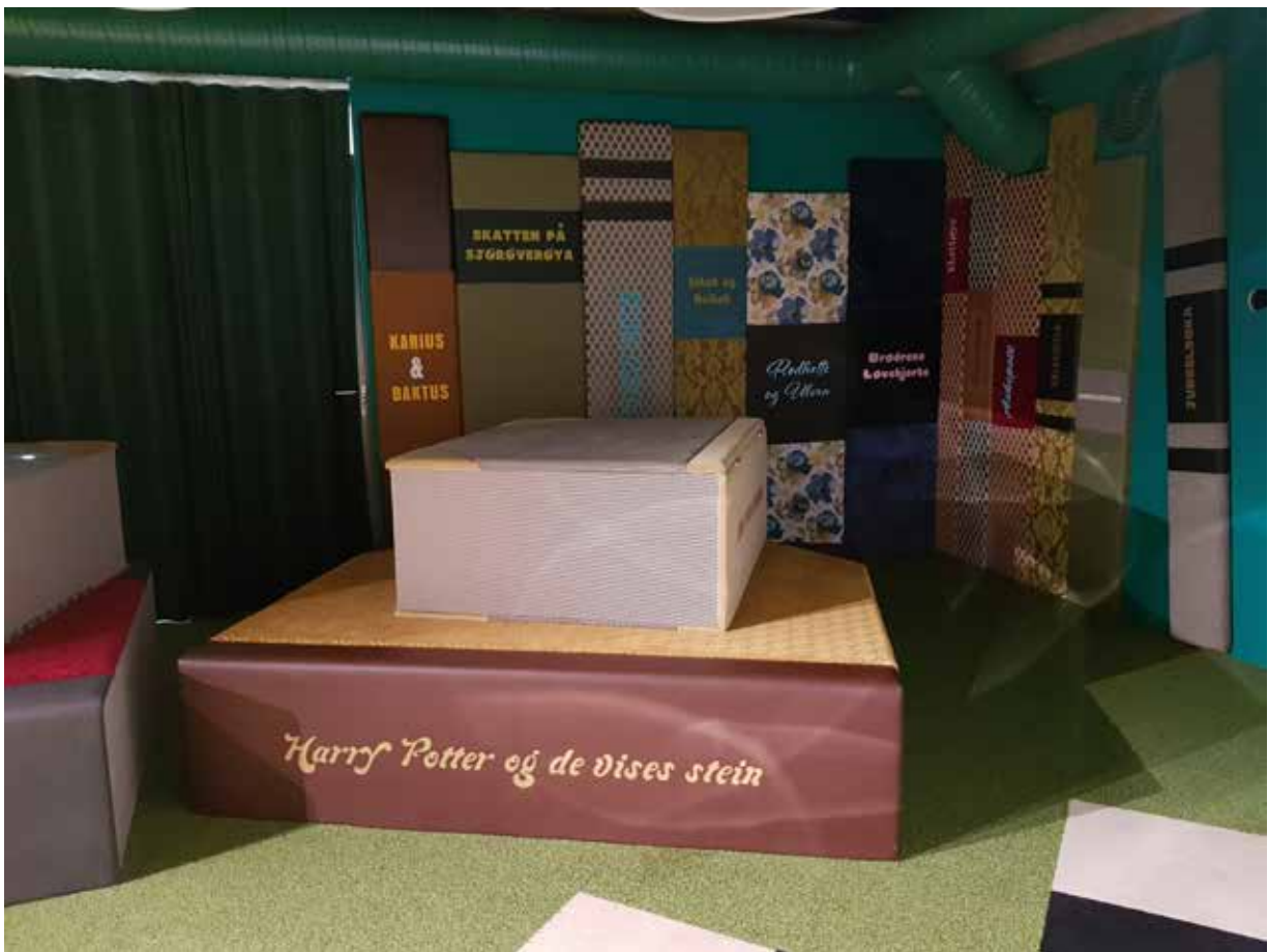
2. etasje. Skattekammeret