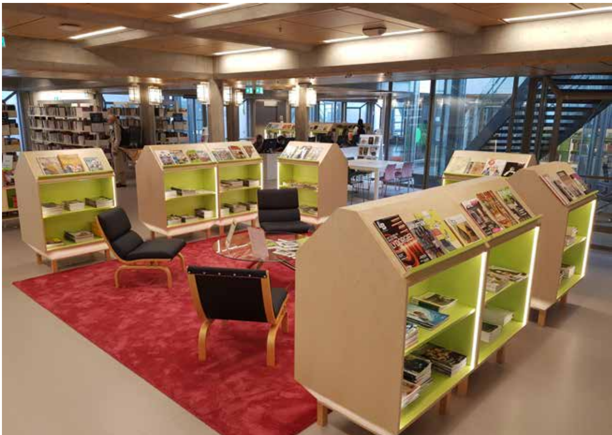
3. etasje. Sittemiljø tidsskrifter