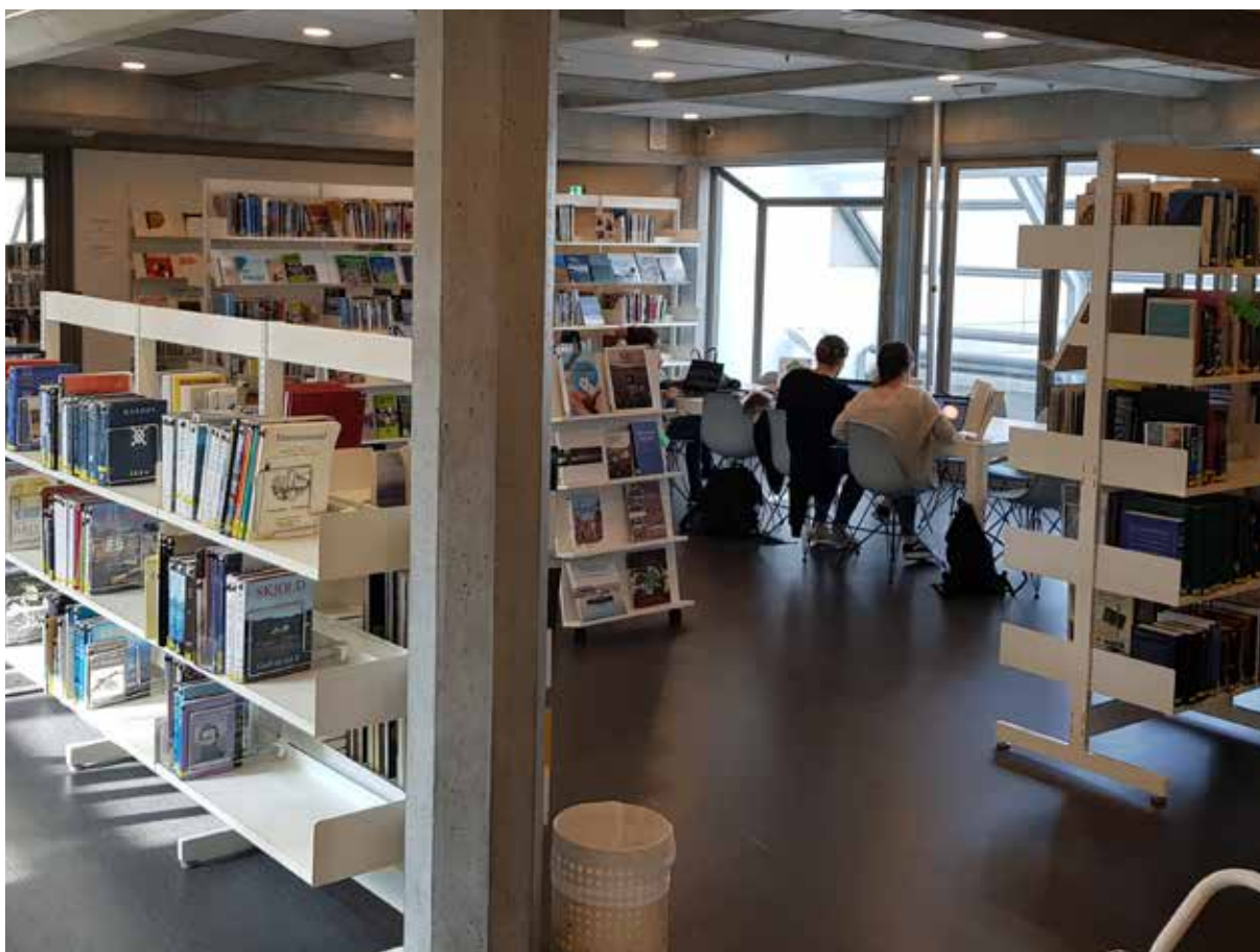
Studeiebord i 4. etasje