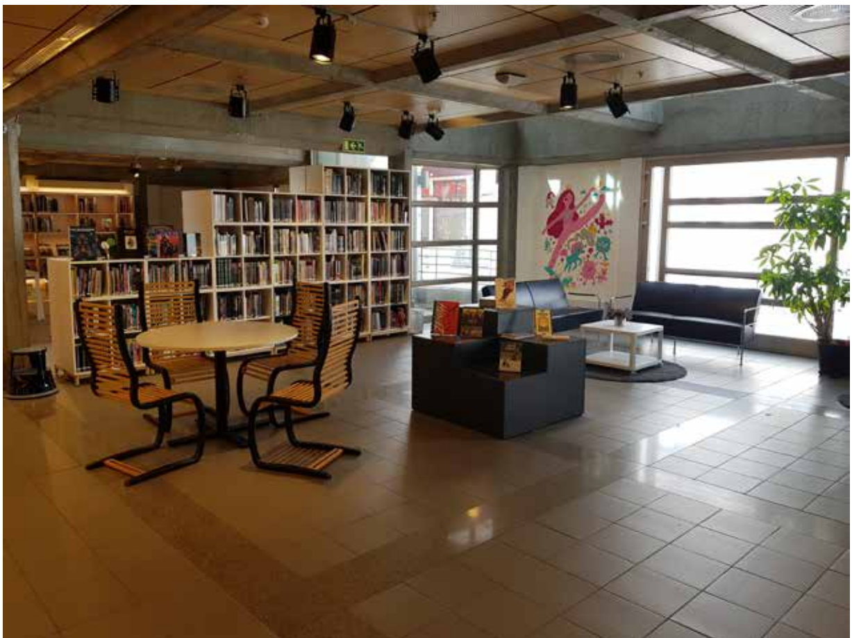
Oversiktsbilder 2. etasje. Tegneserier.