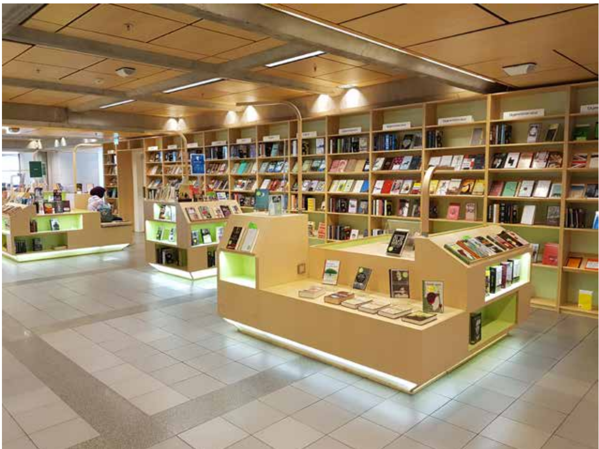
Oversiktsbilde 1. etasje