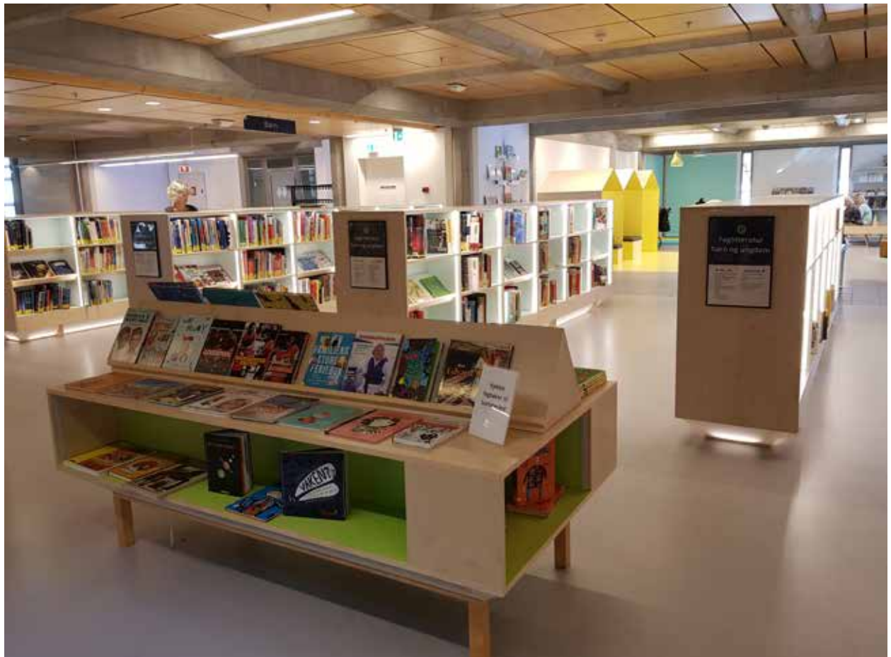
Oversiktsbilder 2. etasje