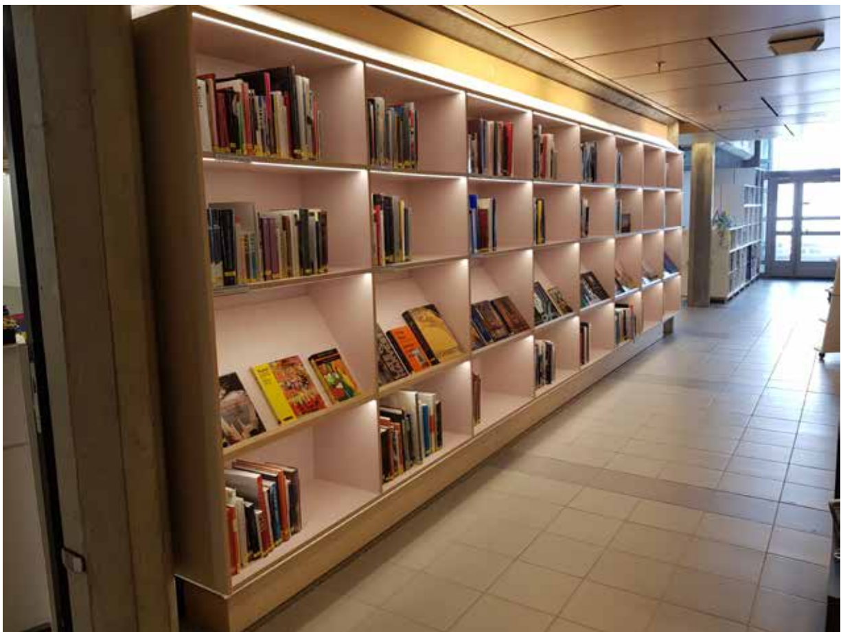
Oversiktsbilder 2. etasje. Kunstbøker.