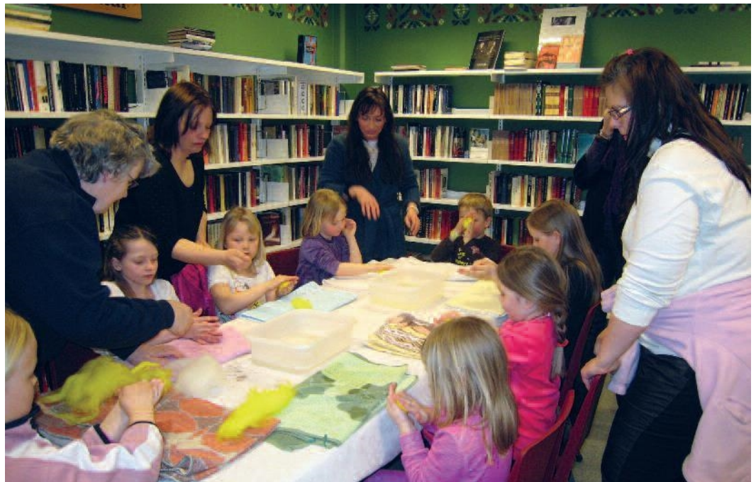
“Påskeverkstad”. Øystre Slidre folkebibliotek.