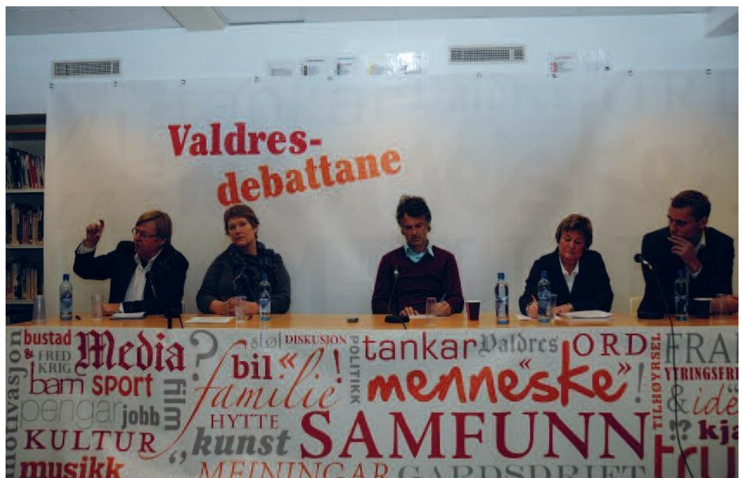
"Valdres-debattane" Nord-Aurdal folkebibliotek.