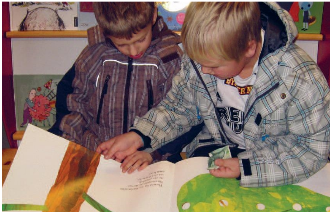
“Gutta leser” Sør-Aurdal folkebibliotek.