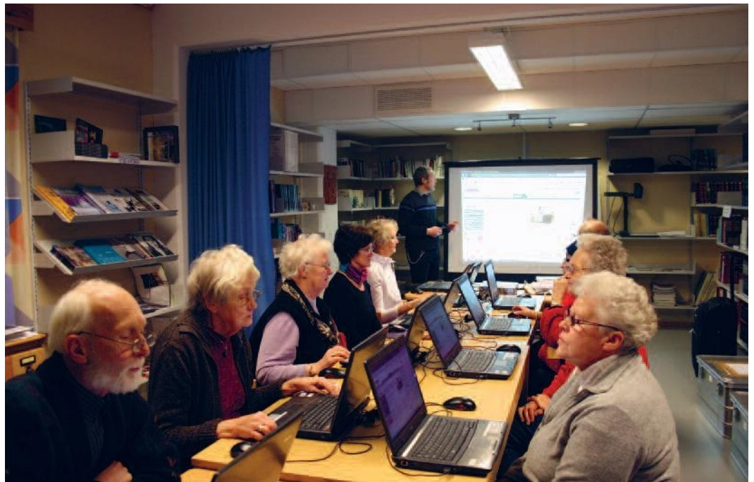
“Seniorsurf” Sør-Aurdal folkebibliotek.