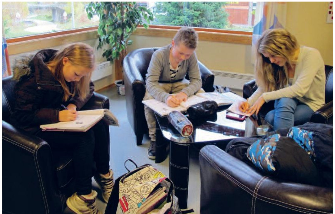
“Lekser” Sør-Aurdal folkebibliotek. Foto: Åse Østgård Hagen