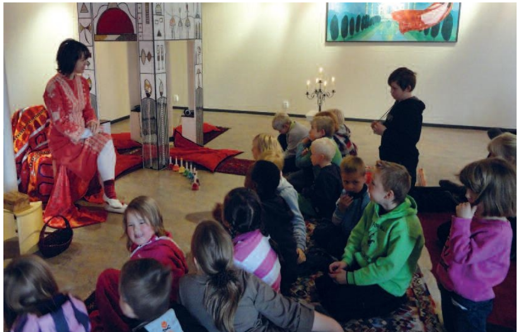
"Arabisk veke" Vang folkebibliotek.