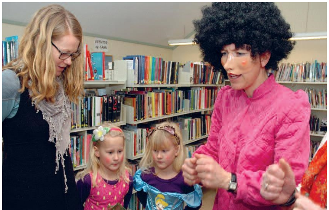
"Julebukkmoro" Vestre Slidre folkebibliotek.