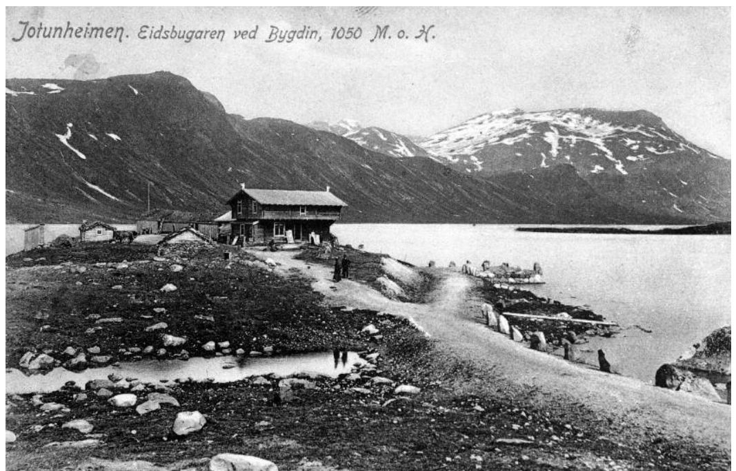
"Eidsbugarden 1908"